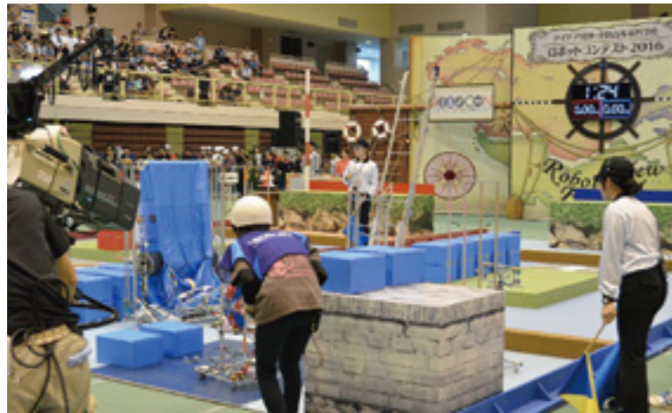
長岡高専ロボティクス部の NHK 高専ロボコン大会出場風景

ロボティクス部は、数多くのロボットに関する大会に出場しています。中でも特にNHK主催の高専ロボコンに力を入れています。高専ロボコンは、毎年変わる競技課題に対して、4月から約半年間をかけてロボットを製作します。私たちの持つ個性的なアイデアを実現するために、技術を磨き、日々活動しています。その他にもロボカップジュニアサッカーでは、自立型ロボットを製作し、大会に参加しています。2017年には全国大会で優勝し、世界大会にも出場しました。学内外問わずロボットの実演を行っており、たくさんの方にロボットの楽しさを紹介しています。私たちの活動への応援をよろしくお願いします。