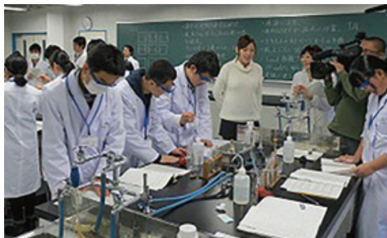
長岡高専化学部の新潟県化学インターハイ出場風景

化学部は、「化学」の面白さをみんなに伝えたい！「化学」の面白さを感じたい！「化学」の知識を高めたい！という目標のもと、日々実験を行っています。私たちはこの体験活動を通して、イベントに来てくれた方々が「化学って面白いな」と感じてくれるように、日々努力しています。最近、「新潟県化学インターハイ」「化学グランプリ」等のコンテストにも参加しています。特に、「新潟県化学インターハイ」では6年連続、総合優勝という栄冠を手に入れました。私たちはこれらの諸活動を通じ、「化学」の面白さを長岡市民の皆様に伝えていきたいと思っています。