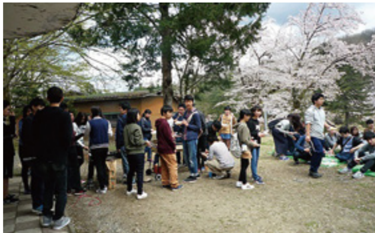
悠久山公園での長岡高専留学生との花見・バーベキュー交流イベント風景

インターアクトクラブとは、社会奉仕と国際交流を目的とするクラブです。『インターアクト (interact)』は『国際的 (international)』と『行動 (action)』の造語です。クラブの活動の中で『奉仕の精神』と『国際理解』を学ぶ機会を多く得ることができます。活動の内容は、長岡高専に在籍する留学生とのバドミントン大会や、冬季・春季のスキー合宿などの国際交流活動、児童養護施設双葉寮の訪問、学内での糸魚川大火義援金の募金などの社会奉仕活動を行ってきました。これからもさまざまな活動を精力的に行っていきたいと思っています。