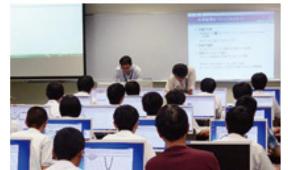
体験学習(プログラミング実習)

体験学習のテーマは毎年更新されます。今年のテーマについては、本校公式ホームページ ( http://www.nagaoka-ct.ac.jp/ ) や各中学校に配布される資料等でご確認ください。