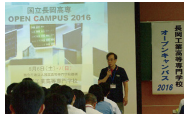
長岡高専校長による開会の挨拶(2016年度)