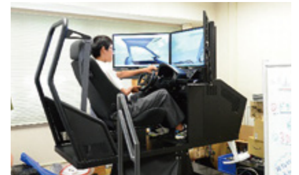
体験学習(ドライビングシュミレーター乗車体験)

この夏、中学生と保護者の皆様を対象とするオープンキャンパスを開催します。学校案内、校内見学、寮の見学&食事体験、体験学習(中学生向け)、進学ガイダンス(保護者向け)など盛りだくさんのメニューで、長岡高専の魅力を余すところなく体感いただけるイベントを企画しています。理工系志望、エンジニア志望の中学生はもちろん、高専に少しでも興味をお持ちの中学生と保護者の皆様は、ぜひご参加ください。(要事前申し込み)